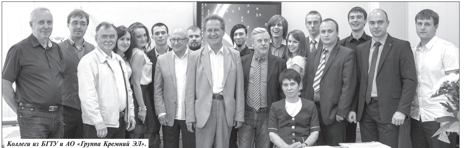
Коллеги из БГТУ и АО «Группа Кремний ЭЛ».